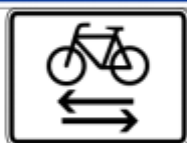
Zeichen 220 Einbahnstraße mit Zusatzschild