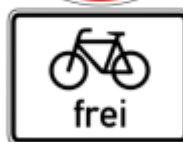
Zeichen 267 Verbot der Einfahrt mit Zusatzschild