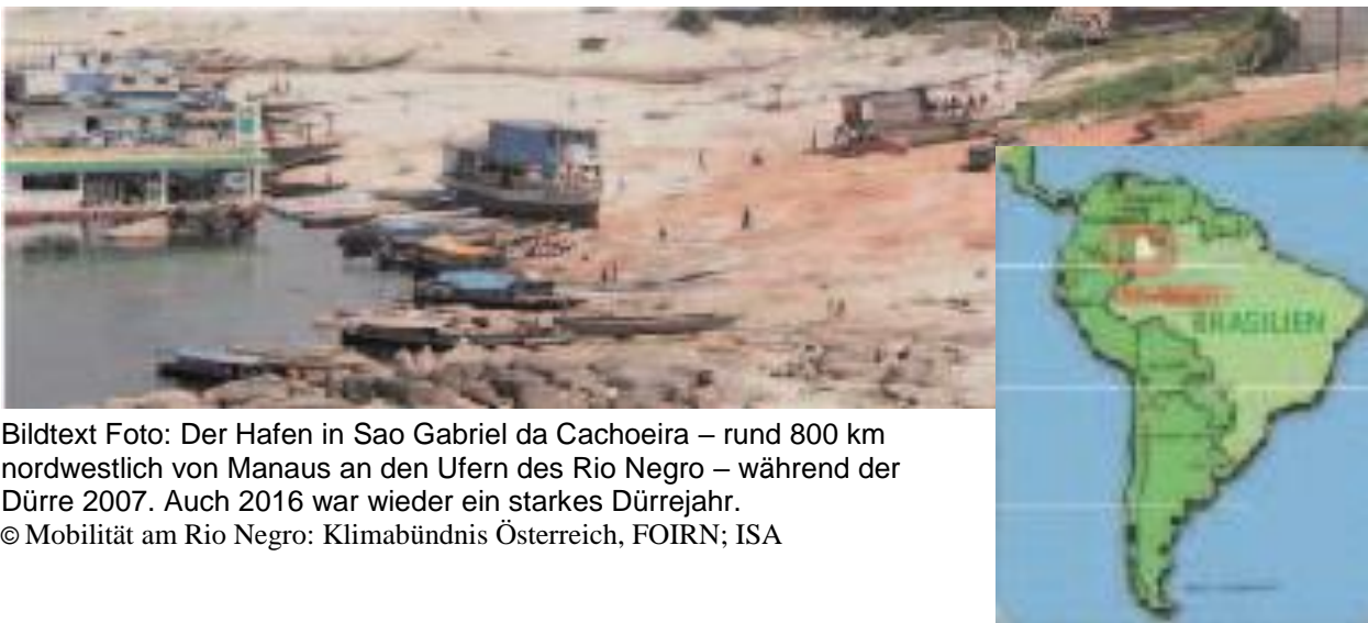
Bildtext Foto: Der Hafen in Sao Gabriel da Cachoeira – rund 800 km nordwestlich von Manaus an den Ufern des Rio Negro – während der Dürre 2007. Auch 2016 war wieder ein starkes Dürrejahr.

In den letzten Jahren verursachte der Klimawandel zusätzliche Probleme – infolge der Dürre sanken die Wasserpegel, Anlegestellen brachen ein, der Bootsverkehr musste eingestellt werden und die Versorgung mit Lebensmitteln und Treibstoffen wurde unterbrochen. Dann kam es wiederum durch Starkregen zu Überschwemmungen, die ebenfalls Uferböschungen und Hafenanlagen zerstörten. Für die Zukunft der Region wäre die Einführung öffentlicher Verkehrsmittel für den Transport der Menschen und Produkte, auf Basis erneuerbarer Energieträger, eine wichtige Maßnahme zur Vermeidung der Abwanderung und für die Regionalentwicklung.